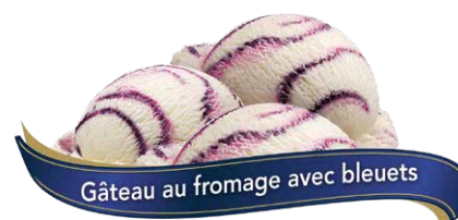
Gâteau au fromage avec bleuets

UPC Code: 0 62942 01016 5 SCC Code: 100 62942 01016 2