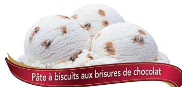
Pâte à biscuits aux brisures de chocolat

Crème glacée au chocolat avec sauce au chocolat et morceaux de brownie au fudge UPC Code: 0 62942 01072 1 SCC Code: 100 62942 01072 8