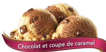
Chocolat et coupe de caramel

Crème glacée Premium avec des morceaux de pâte à biscuits aux pépites de chocolat UPC Code: 0 62942 01032 5 SCC Code: 100 62942 01032 2