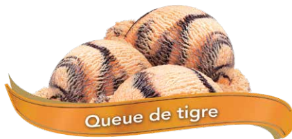
Queue de tigre

Crème glacée à la vanille, chocolat et fraise UPC Code: 0 62942 01014 1 SCC Code: 100 62942 01014 8