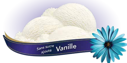
Crème glacée à la vanille crémeuse sans sucre ajouté

UPC Code: 0 62942 01187 2 SCC Code: 100 62942 01187 9