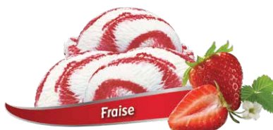
Yogourt glacé aux fraises avec un tourbillon de fraise

UPC Code: 0 62942 01047 9 SCC Code: 100 62942 01047 6