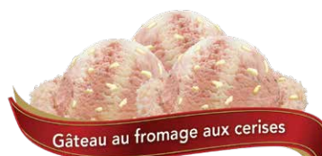
Gâteau au fromage aux cerises

Crème glacée à saveur de gâteau à la vanille avec paillettes colorées et tourbillon de glaçage bleu UPC Code: 0 62942 01085 1 SCC Code: 100 62942 01085 8