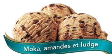
Moka, amandes et fudge

Crème glacée au chocolat et à la guimauve tourbillonnée de morceaux de chocolat et de morceaux de pacanes rôties UPC Code: 0 62942 01034 9 SCC Code: 100 62942 01034 6