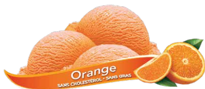
Sorbet à l'orange

UPC Code: 0 62942 01029 5 SCC Code: 100 62942 01029 2