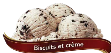
Biscuits et crème

Amandes enrobées de chocolat saupoudrées de crème glacée au moka avec untourbillon au chocolat UPC Code: 0 62942 01062 2 SCC Code: 100 62942 01062 9