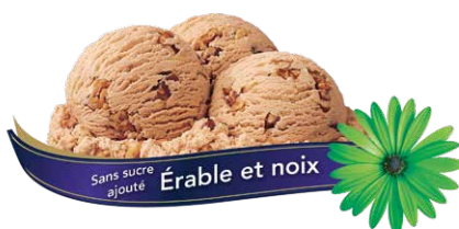
Crème glacée à l'érable avec morceaux de noix croquants sans sucre ajouté

UPC Code: 0 62942 01187 2 SCC Code: 100 62942 01187 9