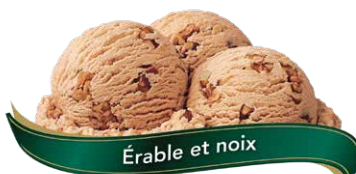
Érable et noix

Crème glacée à la vanille chargée de morceaux de (biscuits) fourrés à la crème au chocolat UPC Code: 0 62942 01063 9 SCC Code: 100 62942 01063 6