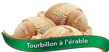
Tourbillon à l'érable

UPC Code: 0 62942 01004 2 SCC Code: 100 62942 01004 9