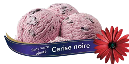
Crème glacée à la cerise noire chargée de morceaux de cerises noires et sans sucre ajouté

UPC Code: 0 62942 01123 0 SCC Code: 100 62942 01123 7