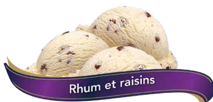
Rhum et raisins

UPC Code: 0 62942 01009 7 SCC Code: 100 62942 01009 4