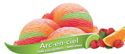
Sorbet à l'orange, framboise et limette

UPC Code: 0 62942 01027 1 SCC Code: 100 62942 01027 8