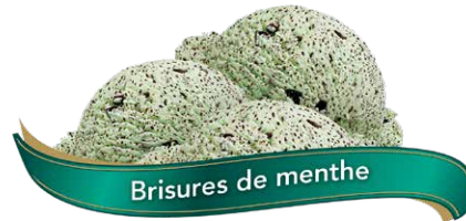
Brisures de menthe

Nous proposons une affiche pour tous vos besoins en boutique!