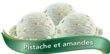
Pistache et amandes

Crème glacée au café avec flocons d'espresso chocolatés UPC Code: 0 62942 01204 6 SCC Code: 100 62942 01204 3