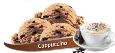
Yogourt glacé à saveur de café avec flocons de chocolat espresso

UPC Code: 0 62942 01043 1 SCC Code: 100 62942 01043 8