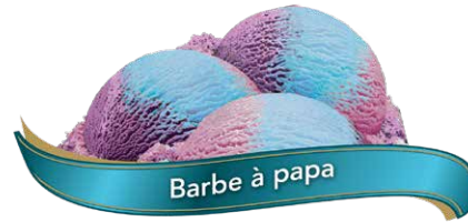
Barbe à papa

Crème glacée à saveur de gomme balloune bleu avec des morceaux à saveur de gomme balloune rose UPC Code: 0 62942 01068 4 SCC Code: 100 62942 01068 1