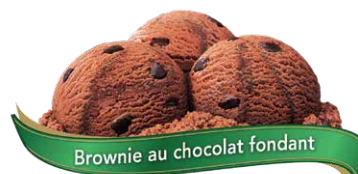
Brownie au chocolat fondant

Crème glacée à l'érable et morceaux de noix croquants UPC Code: 0 62942 01035 9 SCC Code: 100 62942 01035 3