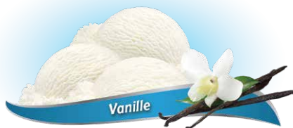
Yogourt glacé à la vanille

UPC Code: 0 62942 01047 9 SCC Code: 100 62942 01047 6