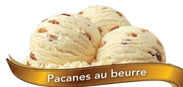
Pacanes au beurre

Crème glacée à la cerise noire chargée de morceaux de cerises UPC Code: 0 62942 01025 7 SCC Code: 100 62942 01025 4