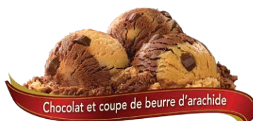
Chocolat et coupe de beurre d'arachide

Crème glacée à saveur de fraise et crème tourbillonnant avec des morceaux de fraises UPC Code: 0 62942 01033 2 SCC Code: 100 62942 01033 9