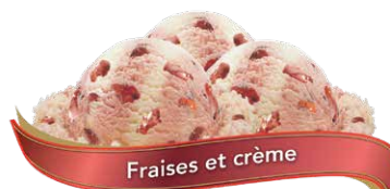
Fraises et crème

Crème glacée au chocolat et au caramel avec des coupes au caramel au chocolat et un tourbillon de caramel riche UPC Code: 0 62942 01146 9 SCC Code: 100 62942 01146 6